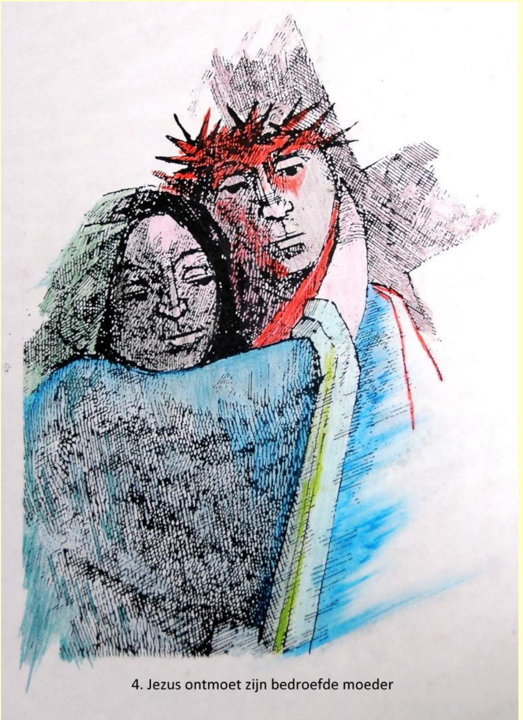
4. Jezus ontmoet zijn bedroefde moeder