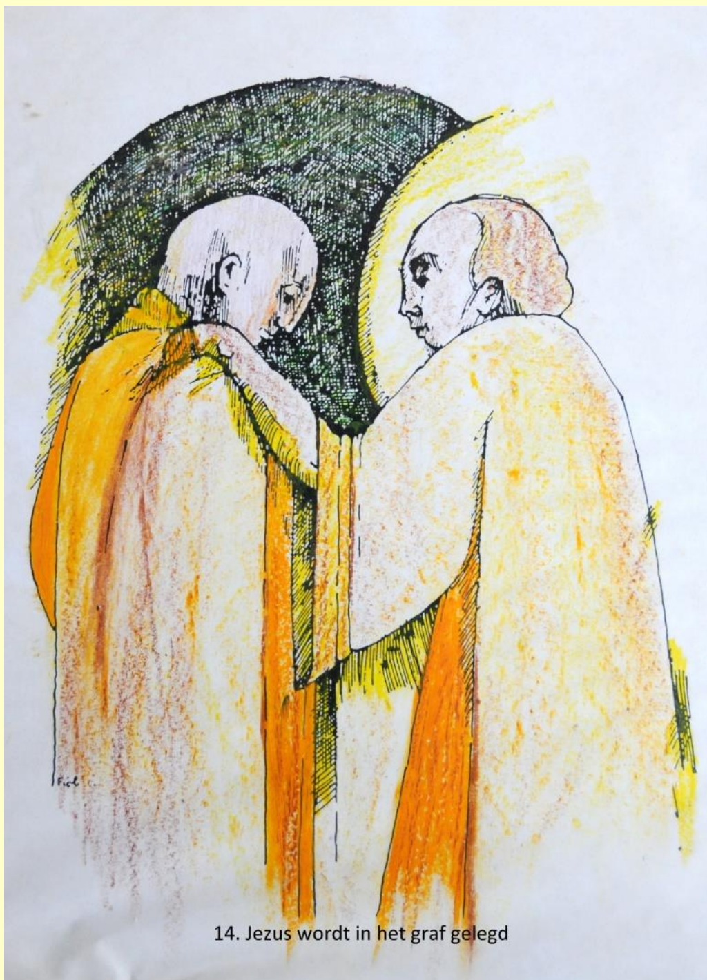
14. Jezus wordt in het graf gelegd