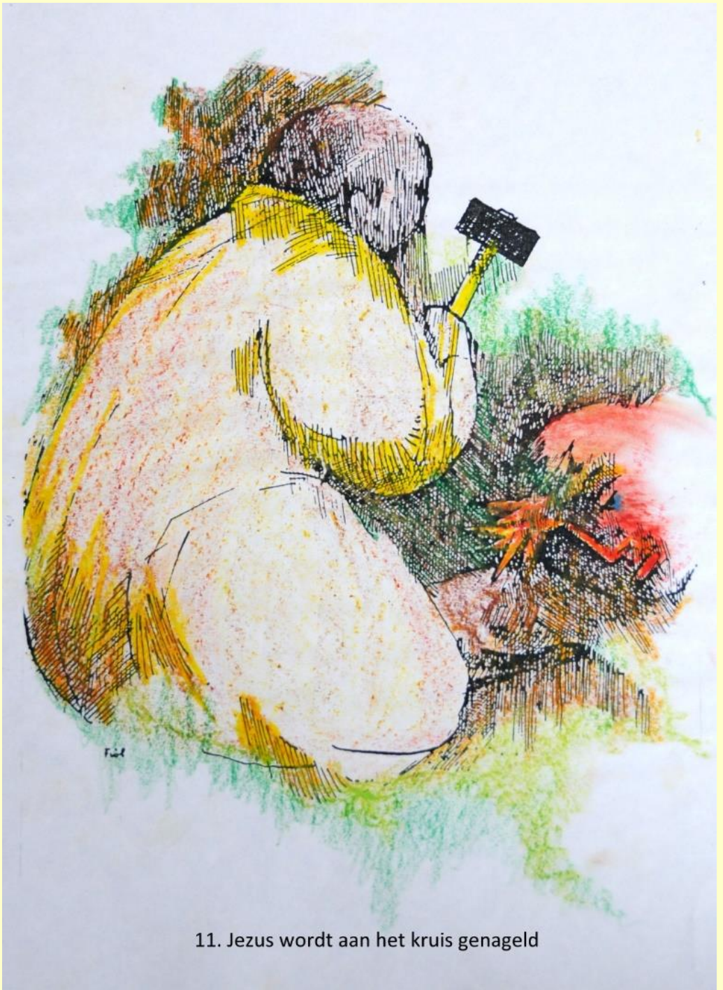
11. Jezus wordt aan het kruis genageld