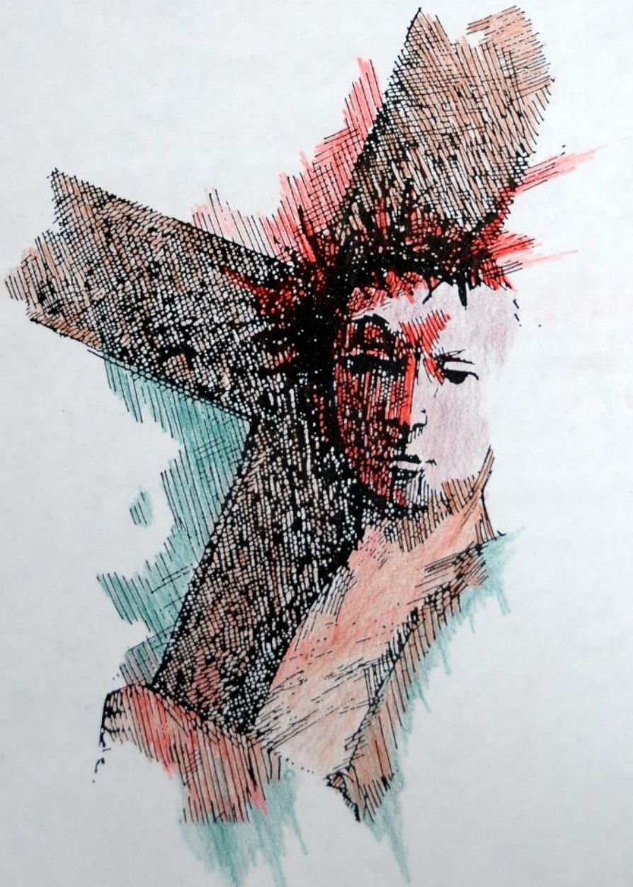
2. Jezus neemt het kruis op zijn schouders