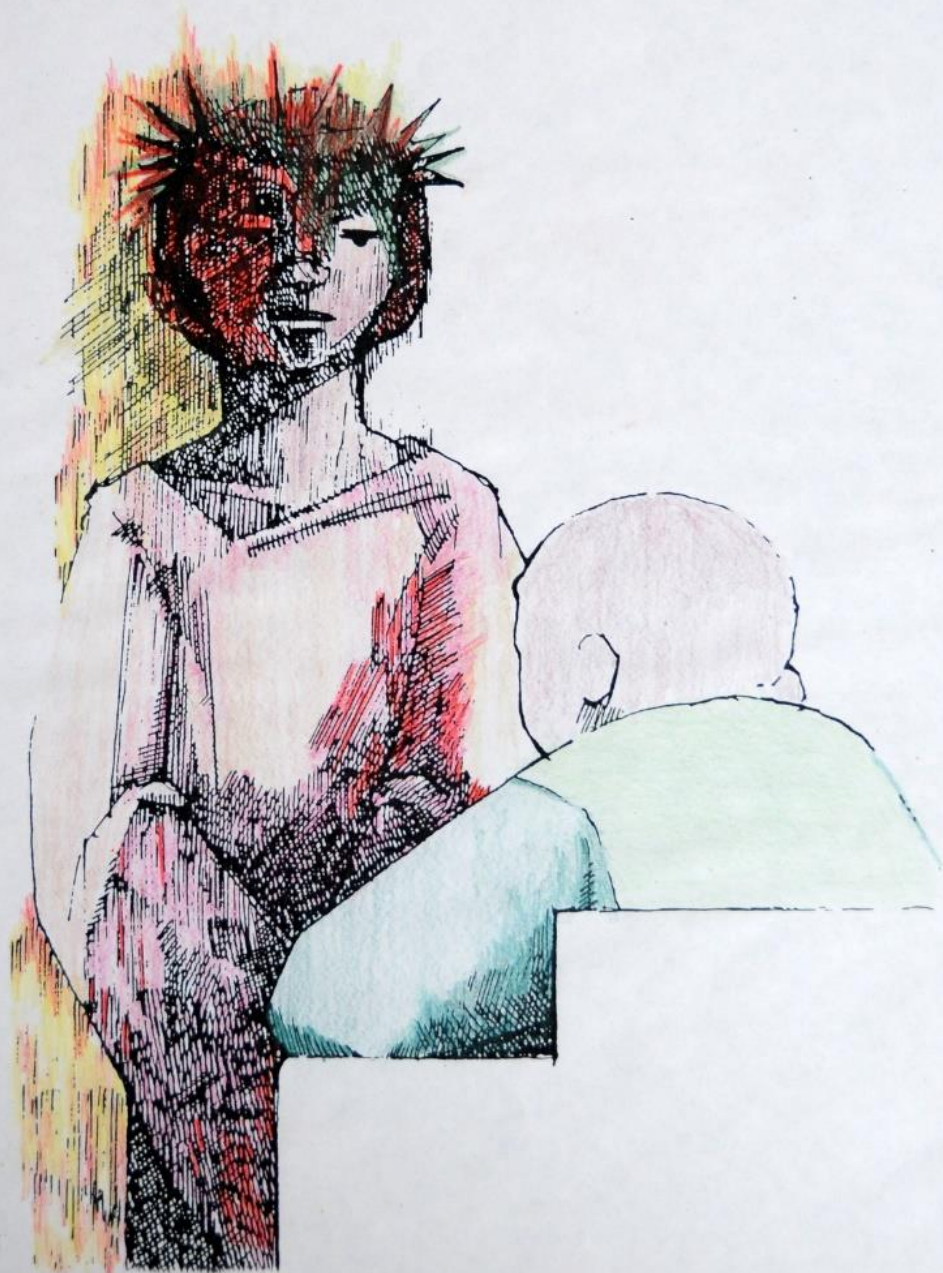
1. Jezus wordt ter dood veroordeeld