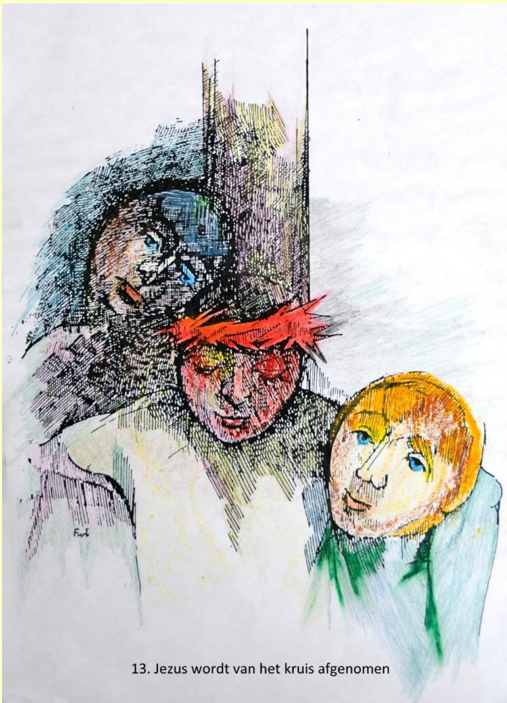
13. Jezus wordt van het kruis afgenomen