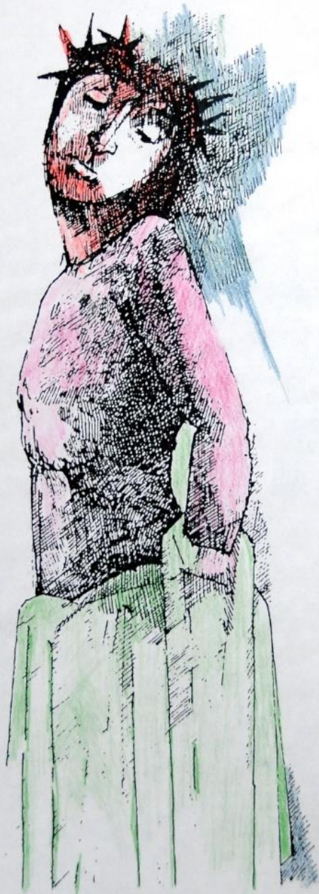
10. Jezus wordt van zijn klederen beroofd