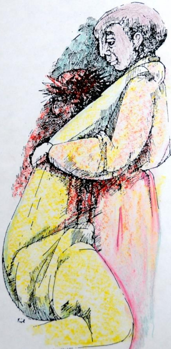
9. Jezus valt voor de derde keer onder het kruis