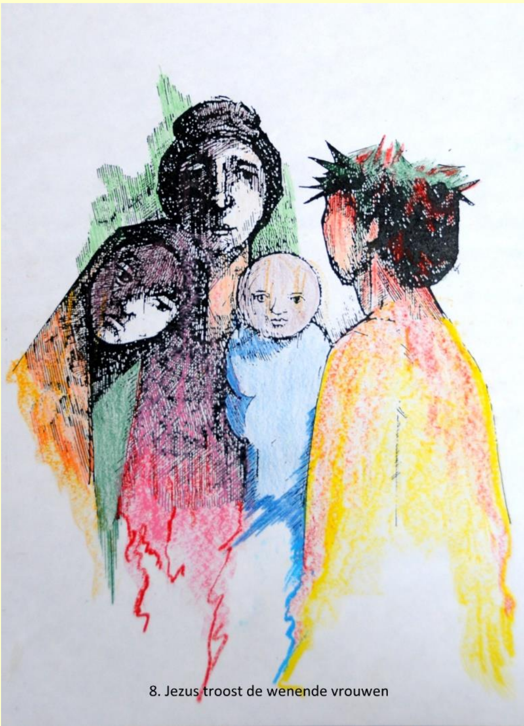
8. Jezus troost de weniende vrouwen