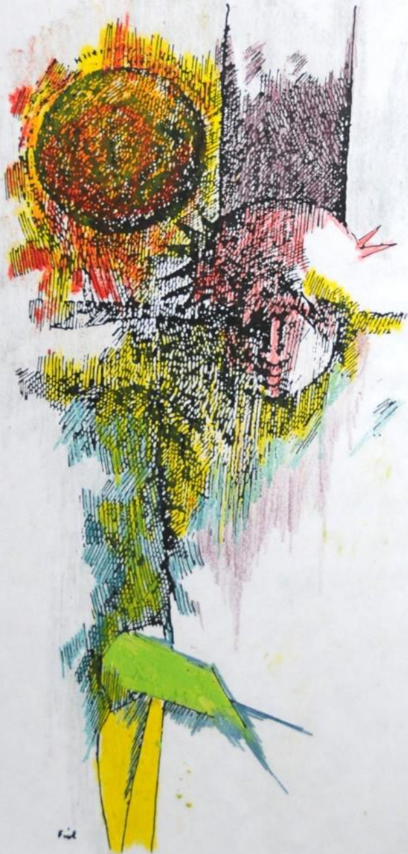
12. Jezus sterft aan het kruis