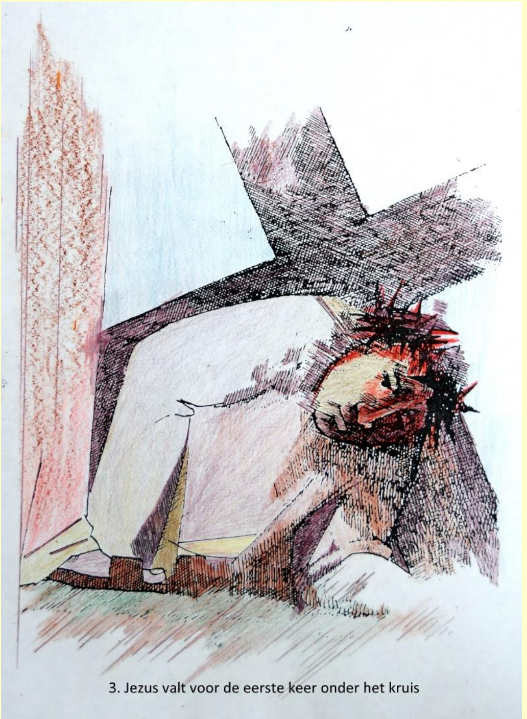
3. Jezus valt voor de eerste keer onder het kruis