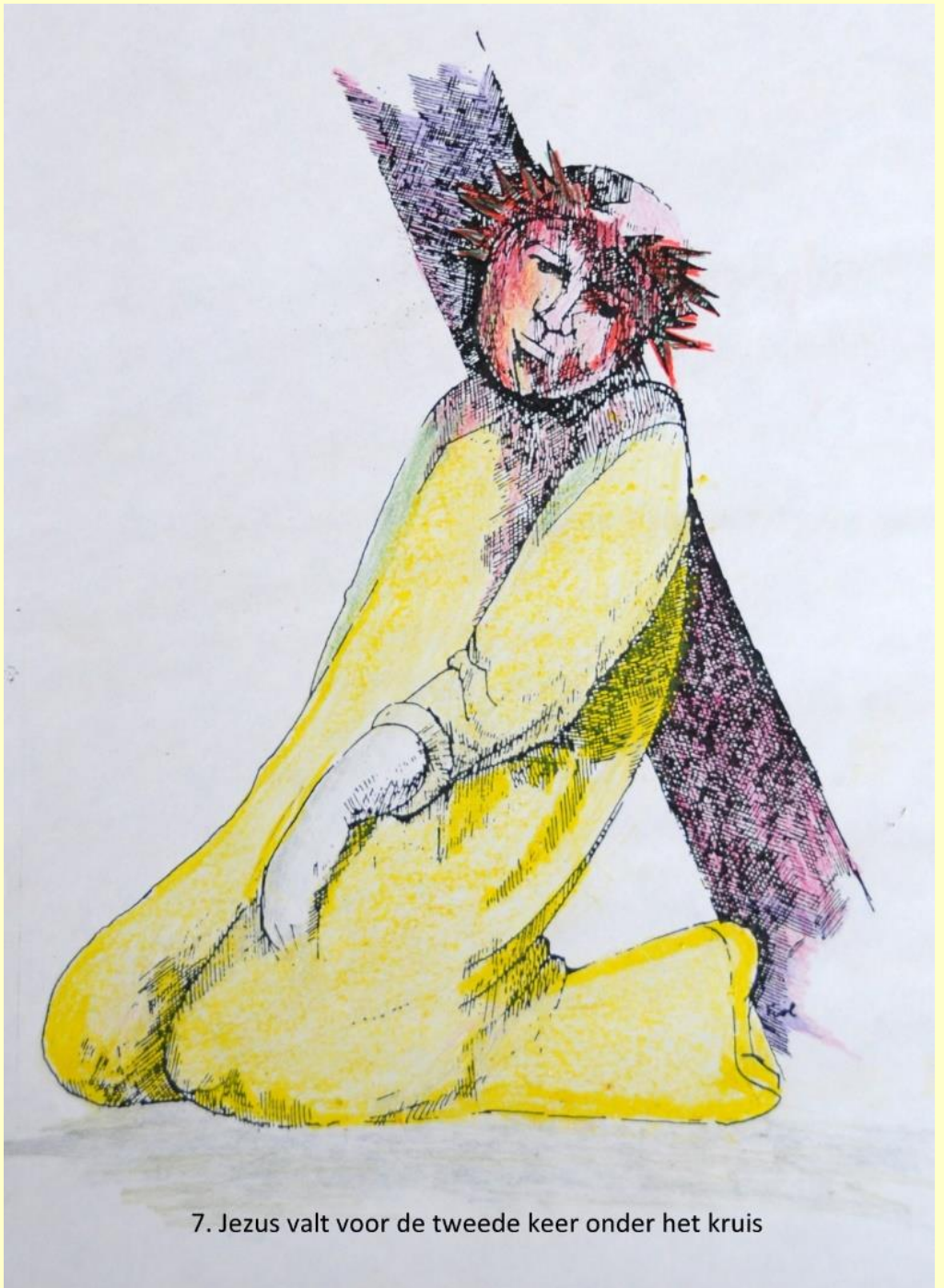
7. Jezus valt voor de tweede keer onder het kruis